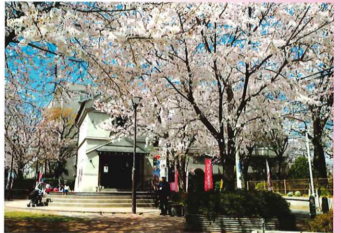
さくらフォトコンテスト受賞作品