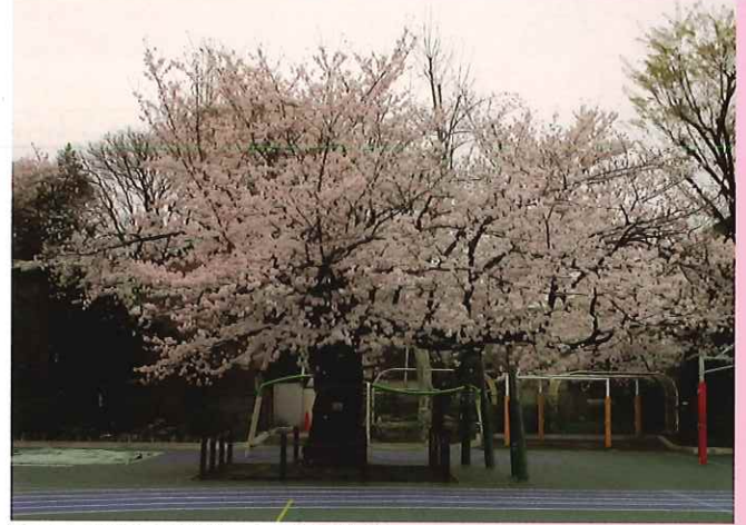
駒込小学校内の基準樹木である駒桜