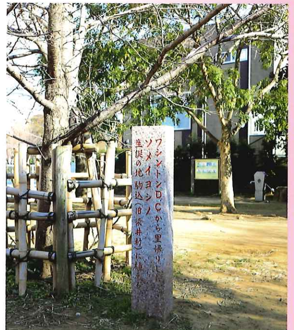
「門と蔵のある広場」にある石碑