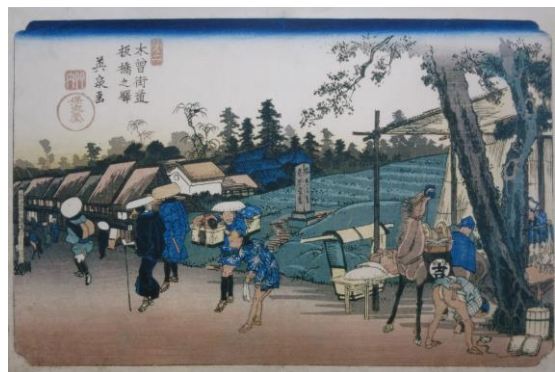
写真は第一の宿場町「板橋宿」を描いたもの