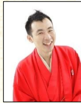
三遊亭 萬橋 師匠

日程：8/16(木) 全1回 時間：14:00～15:30 講師：落語家 三遊亭 萬橋 師匠 定員：20組 費用：無料