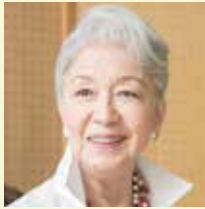
草笛 光子 (くさぶえ みつこ)

神奈川県出身。1950年、松竹歌劇団に入団。在団中に松竹から映画デビューし、退団後も数多くの舞台、映画に出演。1958年、自らが司会を務めた音楽バラエティ番組「光子の窓」がスタートし、人気を博す。日本ミュージカル界の草分け的存在として「ラ・マンチャの男」「シカゴ」の日本初演に参加。映画は「犬神家の一族」「沈まぬ太陽」「武士の家計簿」などで話題を博す。舞台「6週間のダンスレッスン」で読売演劇大賞優秀女優賞、松尾芸能大賞を受賞。また、芸術祭賞を3度受賞している。2013年第48回紀伊國屋演劇賞・個人賞、第39回菊田一夫演劇賞・特別賞受賞。1999年紫綬褒章、2005年旭日小綬章を受章。最近の主な出演作／舞台：「新・6週間のダンスレッスン」「海の風景」「ドライビング・ミス・デイジー」他。映画：「ばあちゃんロード」「殿、利息でござる!」「ある船頭の話」他。ドラマ：「真田丸」「バカボンのパパよりバカなパパ」(NHK)、「戦争めし」(NHK BS)、「プリンセス美智子さま物語 知られざる愛と苦悩の軌跡」(CX)、「静おばあちゃんにお任せ」(EX)、「まだ結婚できない男」(CX) 他。著書：「草笛光子のクローゼット」(主婦と生活社)。