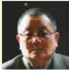
大笹 吉雄 (おおざさ よしお)

神奈川県出身。1950年、松竹歌劇団に入団。在団中に松竹から映画デビューし、退団後も数多くの舞台、映画に出演。1958年、自らが司会を務めた音楽バラエティ番組「光子の窓」がスタートし、人気を博す。日本ミュージカル界の草分け的存在として「ラ・マンチャの男」「シカゴ」の日本初演に参加。映画は「犬神家の一族」「沈まぬ太陽」「武士の家計簿」などで話題を博す。舞台「6週間のダンスレッスン」で読売演劇大賞優秀女優賞、松尾芸能大賞を受賞。また、芸術祭賞を3度受賞している。2013年第48回紀伊國屋演劇賞・個人賞、第39回菊田一夫演劇賞・特別賞受賞。1999年紫綬褒章、2005年旭日小綬章を受章。最近の主な出演作／舞台：「新・6週間のダンスレッスン」「海の風景」「ドライビング・ミス・デイジー」他。映画：「ばあちゃんロード」「殿、利息でござる!」「ある船頭の話」他。ドラマ：「真田丸」「バカボンのパパよりバカなパパ」(NHK)、「戦争めし」(NHK BS)、「プリンセス美智子さま物語 知られざる愛と苦悩の軌跡」(CX)、「静おばあちゃんにお任せ」(EX)、「まだ結婚できない男」(CX) 他。著書：「草笛光子のクローゼット」(主婦と生活社)。