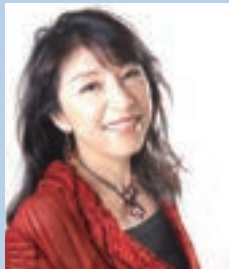
出演:小野リサ(歌、ギター) フェリアン・レサ・パネ(ピアノ)、鈴木広志(フルート、サクス)

ブラジル・サンパウロ生まれ。10歳までブラジルで過ごす。15歳からギターの弾き語りを始め1989年アルバム・デビュー。ナチュラルな歌声、リズムカルなギター、チャーミングな笑顔で瞬く間にボサノバを日本中に広める。ボサノバの神様アントニオ・カルロス・ジョビンや、ジャズ・サンバの巨匠ジョアン・ドナートら著名アーティストとの共演を重ね、ニューヨークやアジア各国でも積極的に公演を行い、海外においても高い評価を得る。99年アルバム「ドリーム」が20万枚を超えるヒットを記録し、日本ゴールドディスク大賞「ジャズ部門」を4度受賞。2013年にはブラジル政府より「リオ・プランコ国家勲章」を授与される等、日本におけるボサノバの第一人者としてその地位を不動のものとしている。